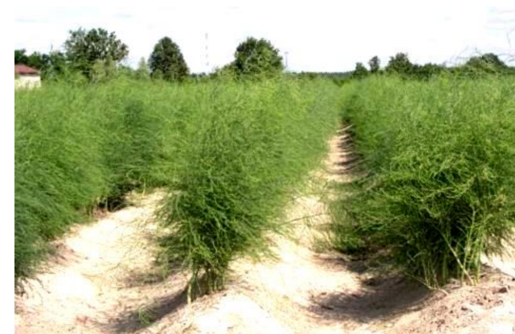
asymilacja po zbiorach