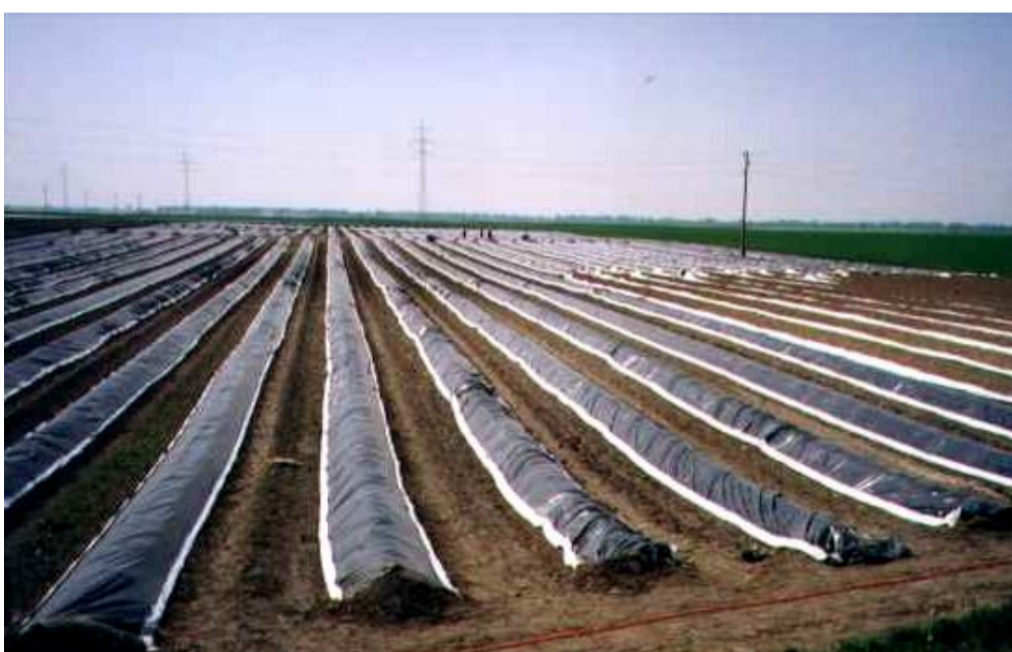
wały przykryte folią