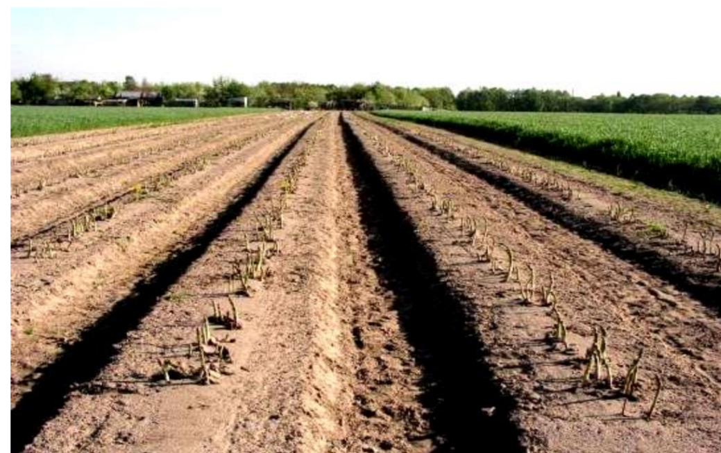
zagony (wypustki zielne)