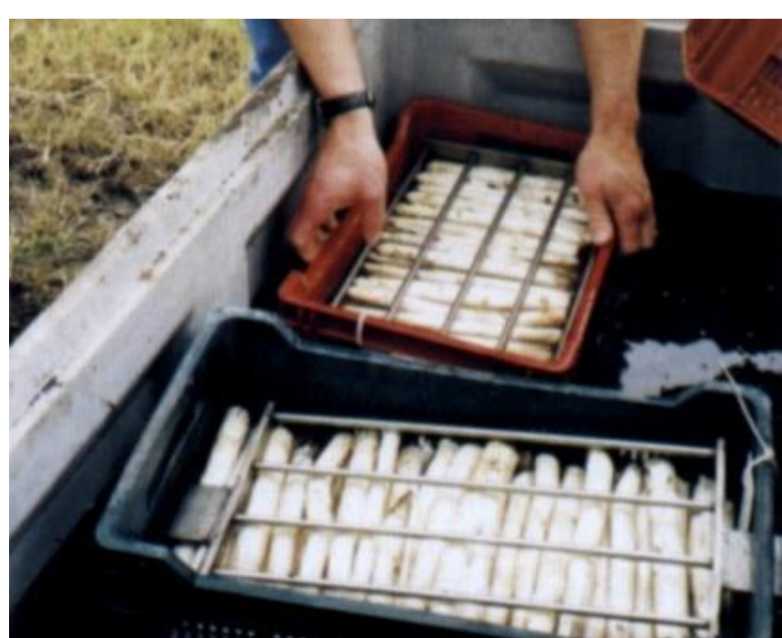
schłodzenie w wodzie