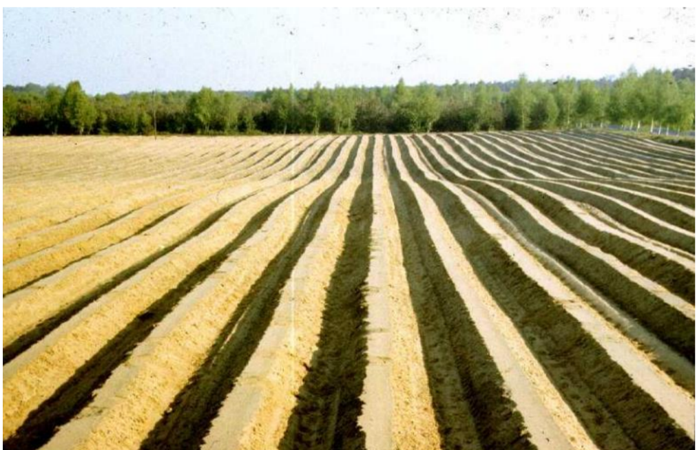
wały (wypustki bielone)